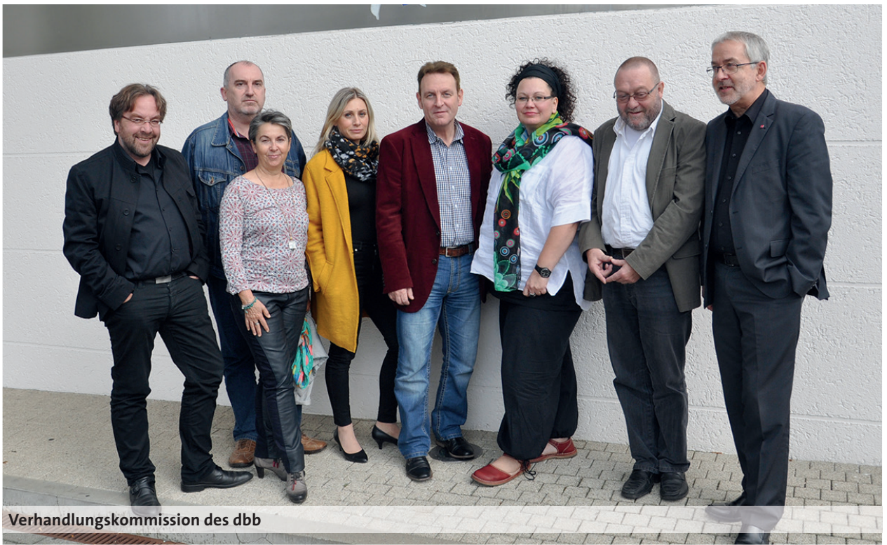
Verhandlungskommission des dbb

mäßiger auf alle Stufen verteilt werden. Dies führt in der S 8a zu einer Anhebung der Beträge gegenüber der aktuellen Entgelttabelle zwischen 93 Euro und 138 Euro. Von der Umverteilung profitieren insbesondere jüngere Beschäftigte. Es war ein Anliegen der Gewerkschaften, gerade im Erzieherbereich das Berufsfeld für Berufseinsteiger attraktiver zu gestalten. In der S 8b führt die Umverteilung zu einem Plus von durchschnittlich 85 Euro im Monat gegenüber der aktuellen S-Tabelle.